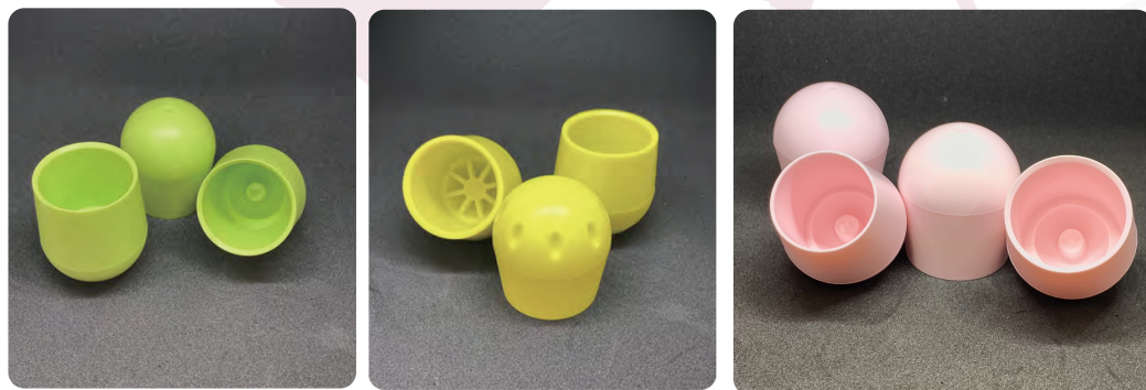
パステルピンクはXS,Sサイズのみ対応となります。

弊社のプラグは、オーバープラグタイプで様々なサイズのポールにご使用いただけます。 プラグは全てのメーカーのプラグの圧縮試験を基に硬度を設定しており、スピリットポールのプラグに近い使用感、踏切時の衝撃もソフトになるように設計しています。